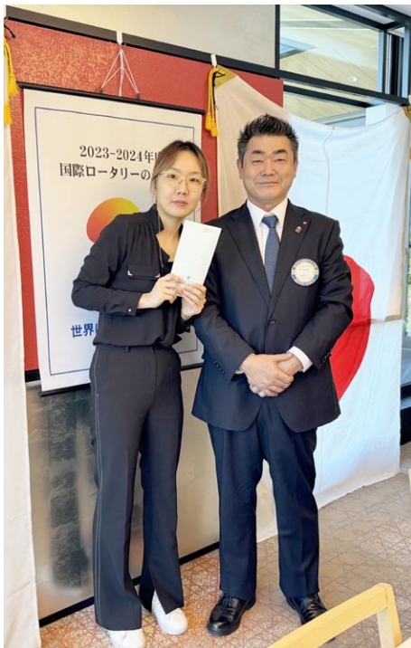
ファンさん奨学金贈呈

今日は「IMについて」という事ですが、IMとは何ぞや？と思い、昨夜ネットで調べました。よろしくお願い致します。