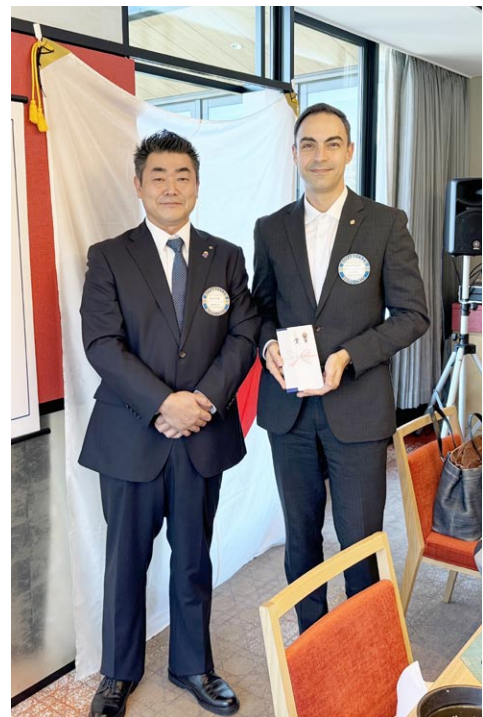
ダヴィデさんソフトボール(敢闘賞?)贈呈